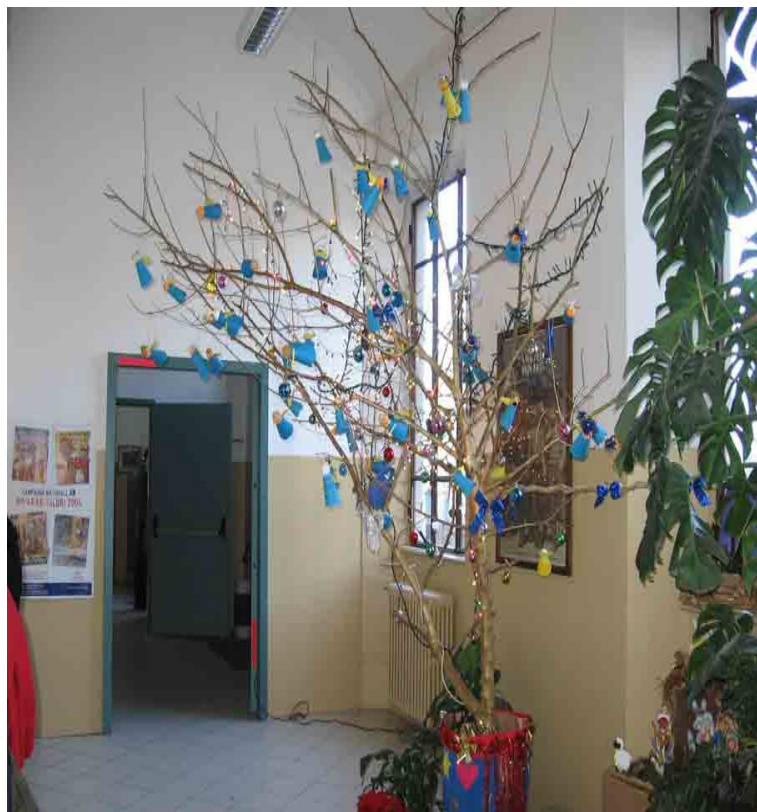
Il nostro albero di Natale ornato con angeli realizzati da noi!!!