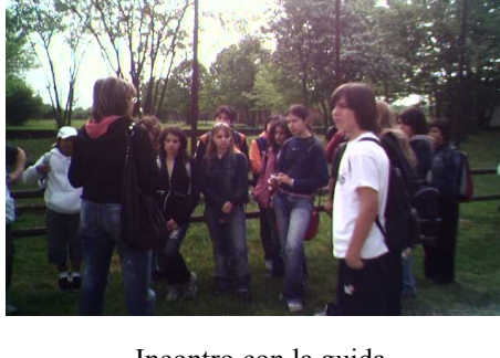
Incontro con la guida