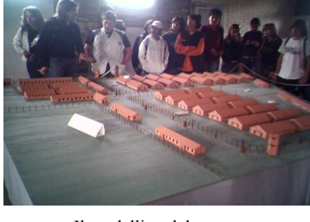
Il modellino del campo