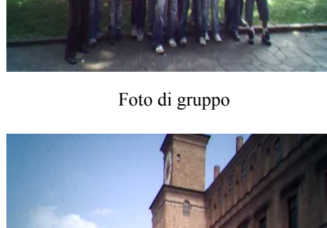
Ritorno a casa