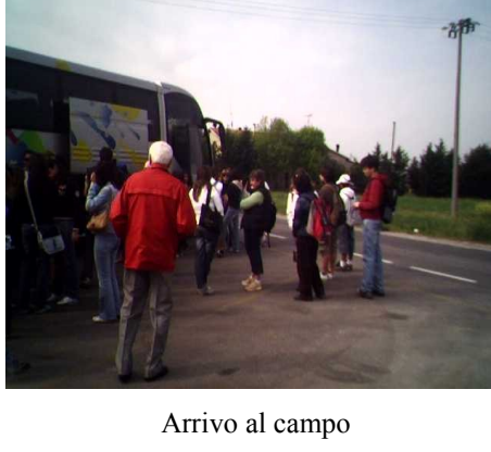
Arrivo al campo