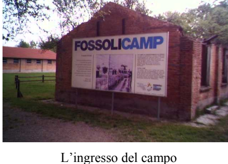
L'ingresso del campo